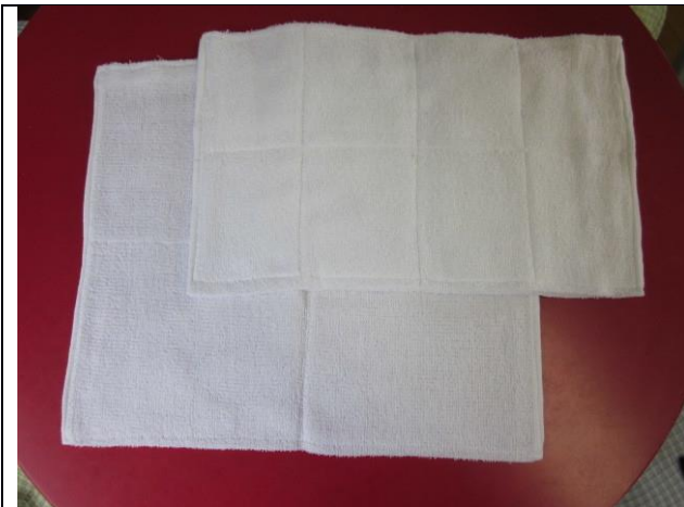
ぞうきん・タオルフキン