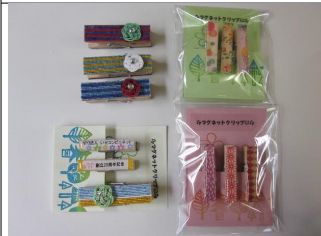
マグネット付クリップ (名入れ可)