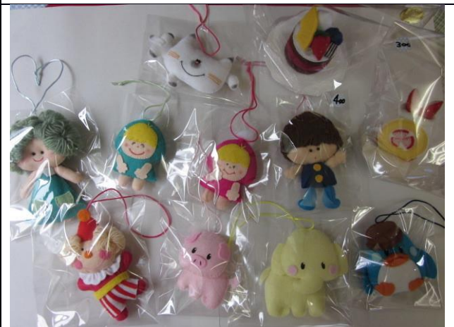
フェルトマスコット各種